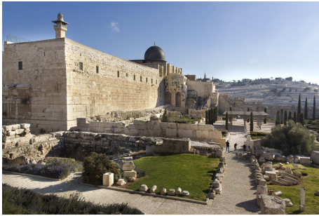
Übernachtung in Jerusalem.